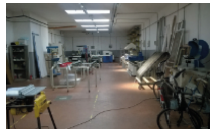
Lo show room di Nichelino e il laboratorio di produzione di Moncalieri. A fondo pagina, un balcone verandato con serramenti in alluminio