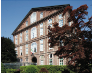
La sede del Csi Piemonte, in corso Unione Sovietica a Torino

In quanti modi si può raccontare l'innovazione? Il Csi Piemonte propone un nuovo format con "Csi Connect, il digitale che unisce", un podcast sulla piattaforma Spotify che racconta temi complessi con un linguaggio chiaro e accessibile a tutti. Disponibile sulle principali piattaforme di ascolto, il podcast ha un obiettivo preciso: aiutare cittadini e imprese a capire, scegliere e orientarsi al meglio, sapendo che ogni gesto quotidiano nel mondo digitale può avere conseguenze importanti. Un mondo virtuale in cui tutti viviamo, spesso senza conoscerlo davvero. Un messaggio vocale inoltrato per sbaglio, una foto che diventa virale, una password scelta con leggerezza: basta un dettaglio per cambiare tutto. Attraverso il contributo di