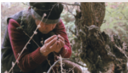
Cecilia Vicuña, Semiya - Seed Song, 2015, 7:43 min, color, sound, Hd video, courtesy of the artist

opera orizzontale sospesa a più altezze. Appartenenti alle antiche civiltà andine, i quipus (nodi in lingua Quechua) sono un'antica forma di scrittura che consiste in corde annodate utilizzate come sistema di registrazione di informazioni, tra cui dati di carattere storico-narrativo, amministrativo oppure astronomico. Il nuovo quipu sarà una presenza evocativa dello scorrere del tempo, umano e geologico, del movimento di elementi naturali come vento e acqua, e della transitorietà della presenza umana rispetto all'ambiente. La mostra include opere video. Info: castellodirivoli.org