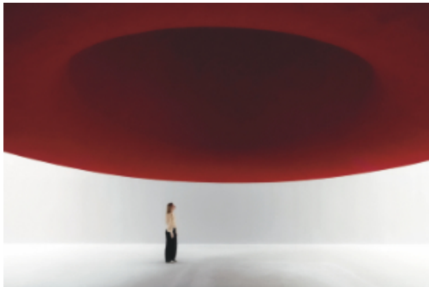
Un'installazione di Anish Kapoor alla Biennale di Venezia 2026

La piattaforma gestionale "Tela", sviluppata dall'impresa innovativa Hpa e supportata dall'Incubatore del Politecnico di Torino (I3p), è stata scelta per la gestione della biglietteria online e della vendita dei materiali collegati alla nuova mostra di Anish Kapoor, celebre scultore britannico di origine indiana, nel contesto della 61ª Esposizione Internazionale d'Arte della Biennale di Venezia. L'esposizione è in programma dal 4 maggio all'8 agosto presso Palazzo Manfrin a Venezia, in Fondamenta Venier 342, nel sestiere di Cannaregio. La mostra veneziana dedicata ad Anish Kapoor presenta un nucleo di circa 100 modelli architettonici, affiancati da sculture di grande scala e opere a specchio, offrendo una panoramica su oltre cinquant'anni di ricerca dell'artista. Per Tela si tratta di un traguardo particolarmente rilevante: la piattaforma è stata adottata in un contesto espositivo internazionale che ruota attorno a uno dei nomi più riconosciuti dell'arte contemporanea. L'incarico per