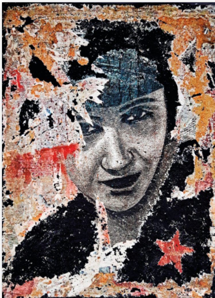
Vittorio Varrè, "Partigiana", tecnica mista su tela, formato 152x110 cm, anno 2025, www.vittoriovarre.com

È mancato nella sua Bra, il 21 maggio scorso Fondatore di Slow Food e di Terra Madre