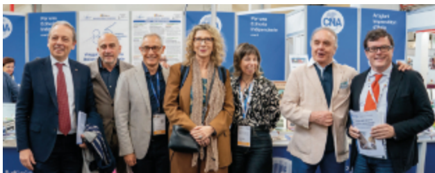
I relatori e i rappresentanti istituzionali davanti allo stand nazionale della CNA e al termine del convegno al Salone del libro

attività iscritta all'Albo delle imprese artigiane. Tra i principali punti deboli dell'editoria italiana il position paper della CNA individua: la distribuzione libraria, concentrata nelle mani di pochi colossi; la difficoltà a