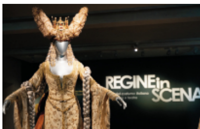
"La regina degli specchi", abito indossato da Monica Bellucci in "I fratelli Grimm" di Terry Gilliam, 2005

ne tematico espositivo della Reggia di Venaria dedicato alla moda e al costume avviato nel 2011 con "Moda in Italia. 150 anni di eleganza (1861-2011)". Ma il racconto della sovranità femminile è anche un modo per tornare alla nascita del complesso della Venaria Reale, alla metà del Seicento, in cui ebbero un ruolo centrale le duchesse Cristina di Francia e Maria Giovanna Battista di Savoia Nemours. Il percorso narrativo della mostra si articola attorno a tre nuclei fondamentali - mito, storia, fantasia - che si intrecciano nella costruzione dell'immaginario scenico, tra ricerca filologica e interpretazione poetica. Regine mitologiche e leggendarie, regine fantastiche nate dalla letteratura e dalla drammaturgia e sovrane realmente esistenti convivono in un racconto che supera la distinzione tra vero e immaginato, affermando una verità più profonda: quella del linguaggio visivo. Info: lavenaria.it